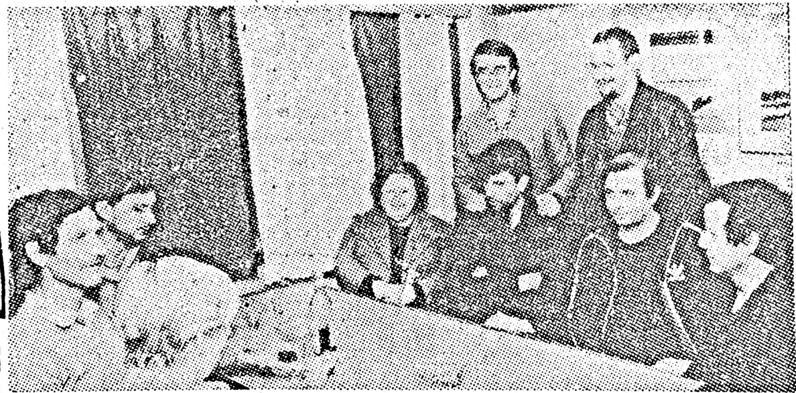
Лађари са својим породицама

Када су истоварили свој терет помогли су, и посади „Салајке“, тако што су их растеретили за 450 тона ђубрива, које су поново пренели до Келхајма. Враћајући се ку